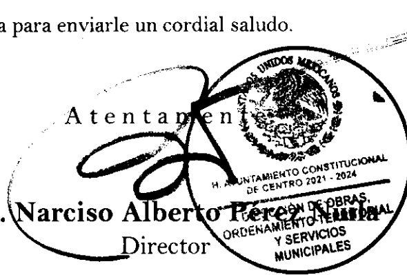
Zoila de Dios Segura Elaboró