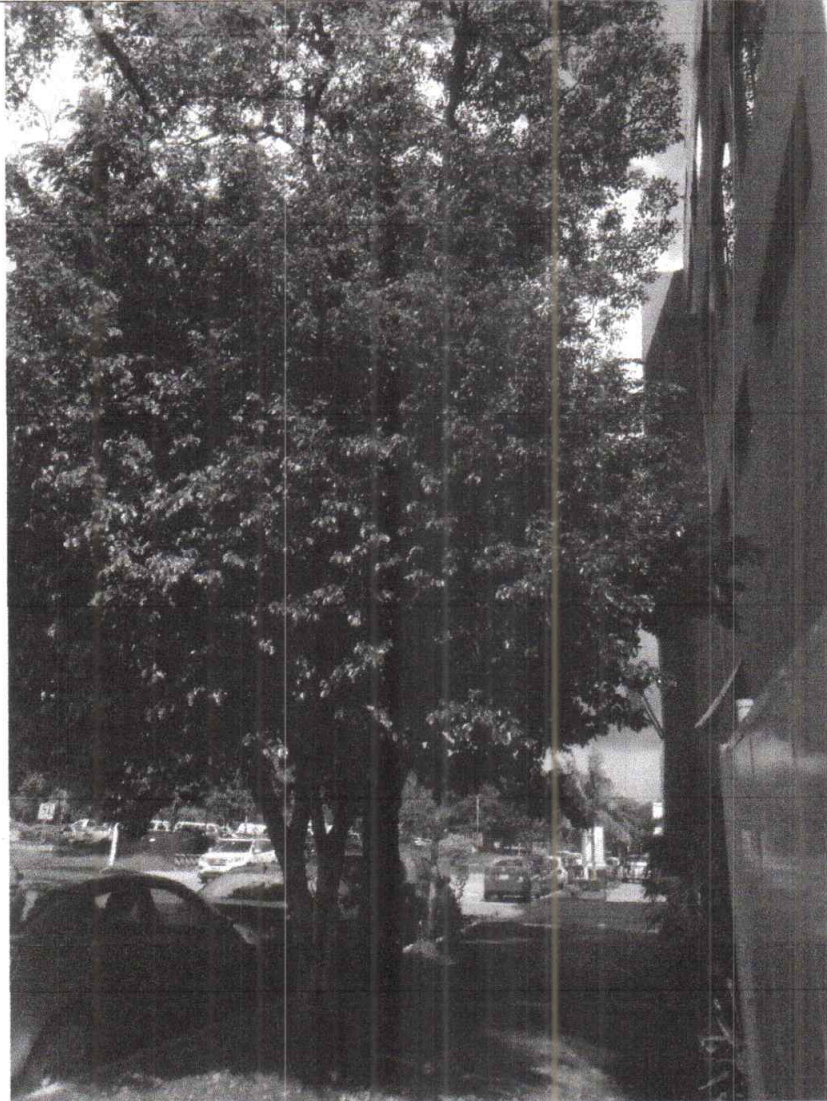
Foto 1. Vista frontal del árbol de Ficus y Maculis donde se aprecia la obstrucción del techado y ventanas por la copa del árbol.