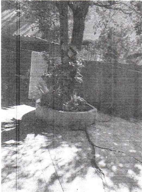
Foto 1. Se aprecia especie de Nance dentro de la casa de la promovente