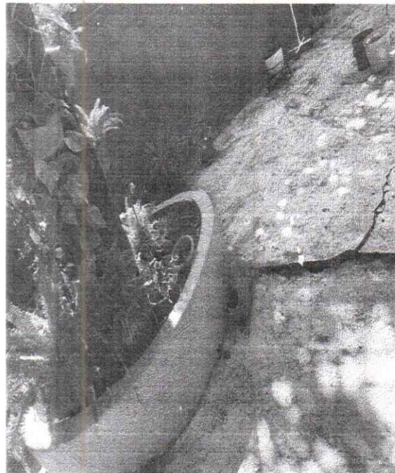
Foto 2. Se logra observar el levantamiento de la cimentación a causa de la raíz del árbol de Nance