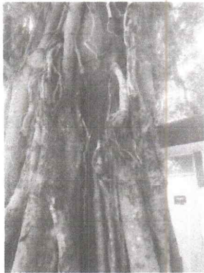
Foto 3. Se logra observar la especie con cortes en sus raíces