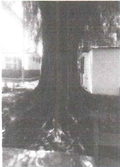
Foto 1. se observa especie de Ficus de hule