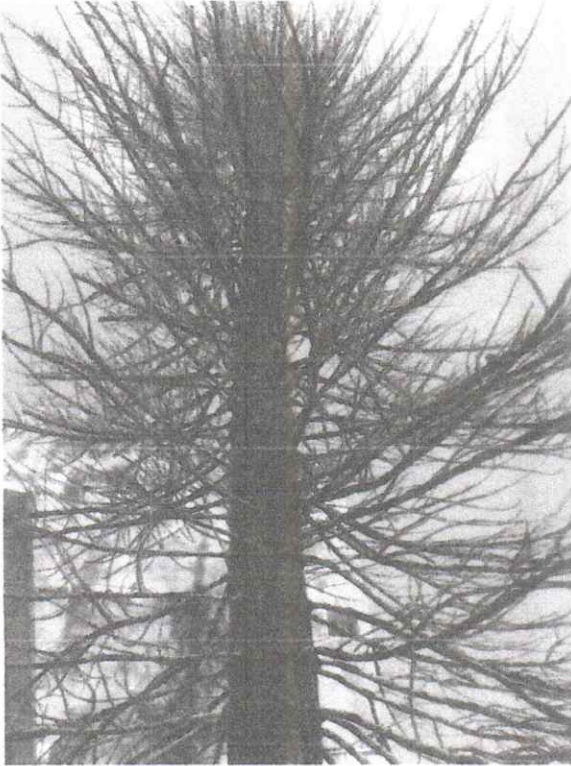
Foto 1. Se aprecia especie de Pino muerta en pie.