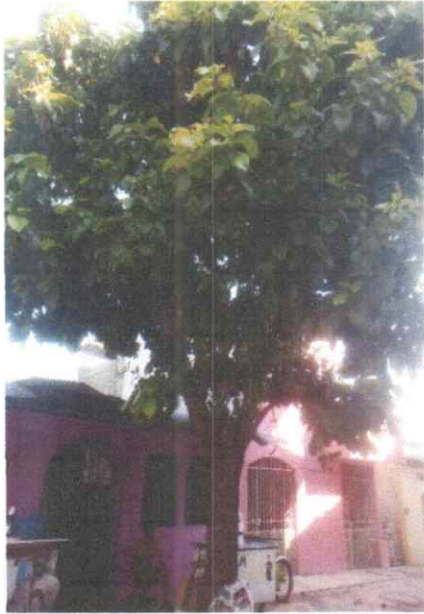
Foto 1. Se observa especie de Aguacate