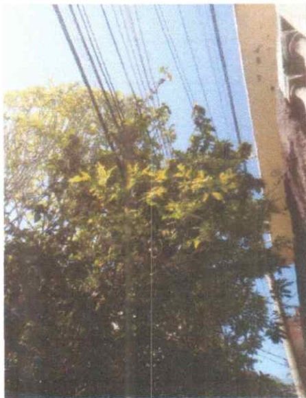
Foto 3. Especies de arbustos obstruyendo el cableado eléctrico.