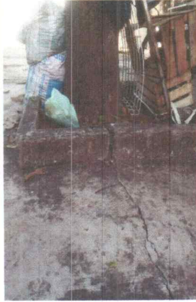
Foto 2. Se aprecia ruptura de la cimentación por raíces de la especie de Aguacate