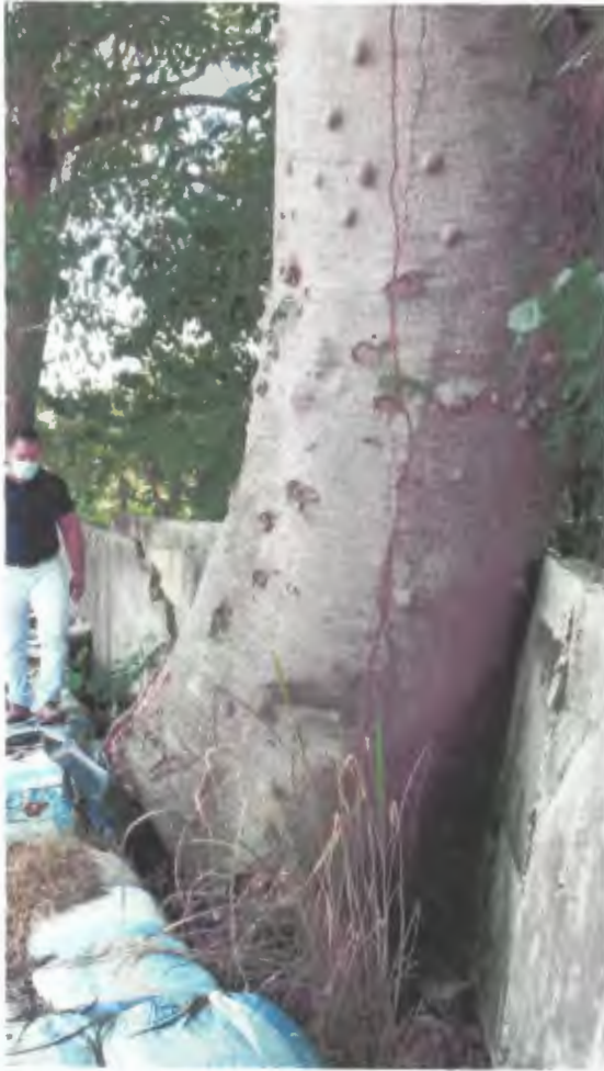
Foto 1. Especie de Guanacaste con inclinación hacia la barda perimetral.