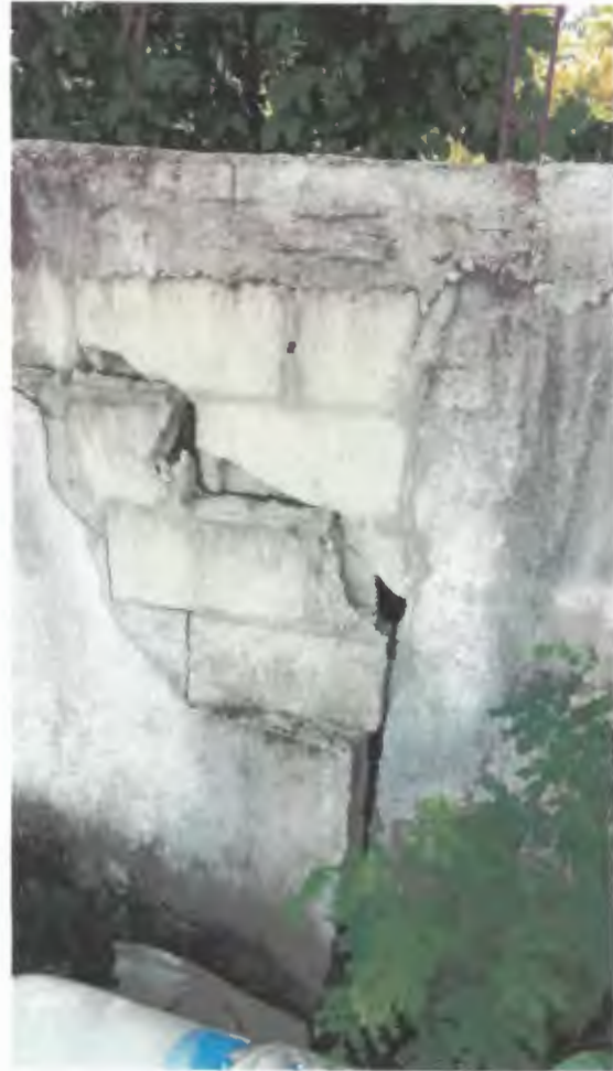
Foto 2. Se observan los daños que la especie de Guanacaste ocasiono a la barda.

A handwritten signature in blue ink, consisting of a stylized 'A' followed by a large 'E'.