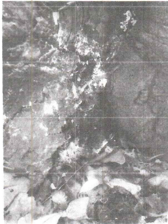
Foto 2. Se logra apreciar la cavidad en la parte inferior del tronco.