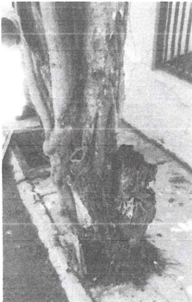
Foto 1. Se observan cavidades putrefactas en el tronco principal de la especie de Ficus