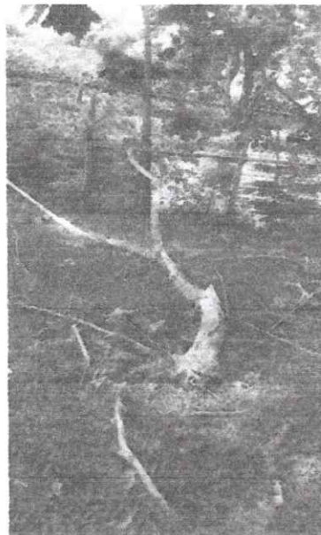
Foto 3. Ramas desgajadas de la especie arborea Guanacaste