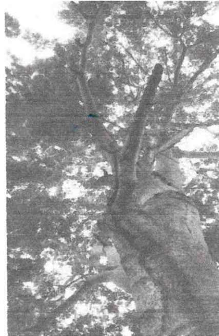
Foto 2. Se observan ramas putrefactas de la especie de Guanacaste