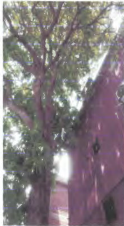
FOTO 2.- Se observa la extensa rama del condominio.