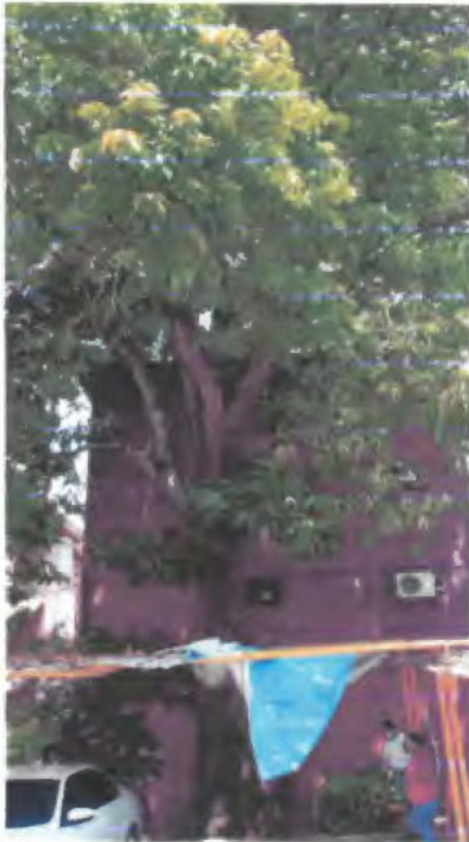
FOTO 1.- Se observa las hojarascas en parte del techado de los cajones del estacionamiento.