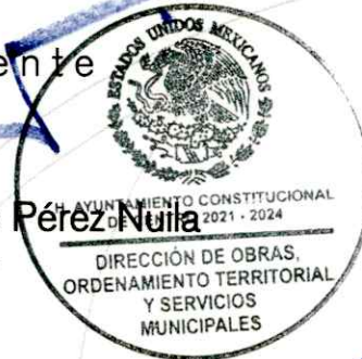
Zoila de Dios Segura Elaboró