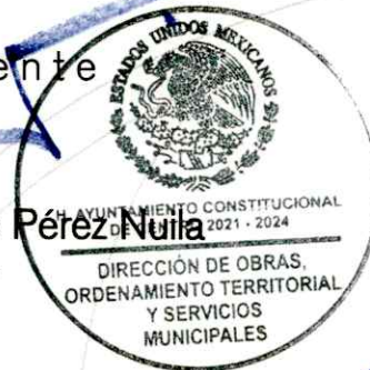
Zoila de Dios Segura Elaboró