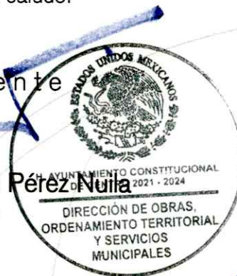
Zoila de Dios Segura Elaboró