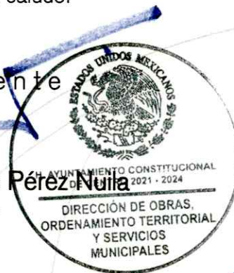
Zoila de Dios Segura Elaboró