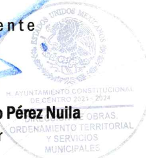
C. Zoila de Dios Segura Elaboró