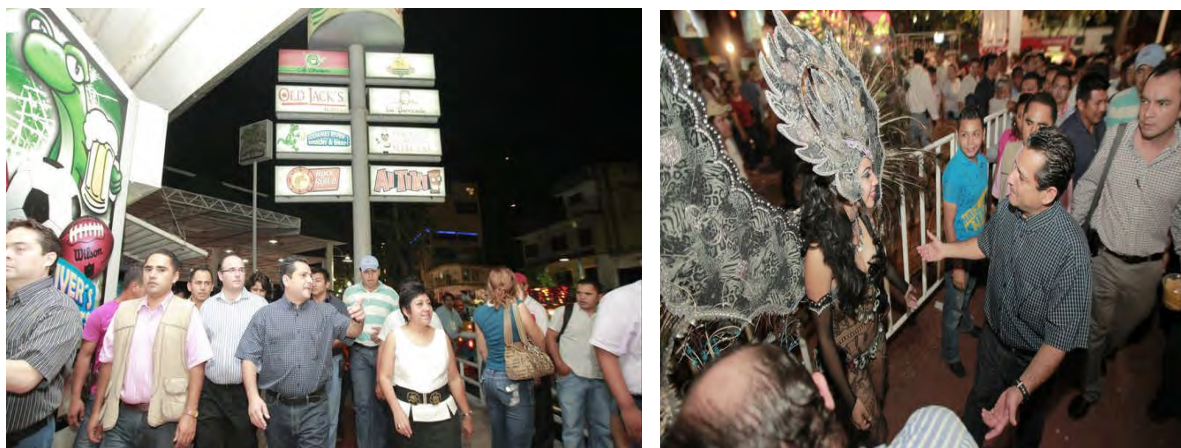
Fotos del Carnaval 2011, en las Instalaciones del CENMA