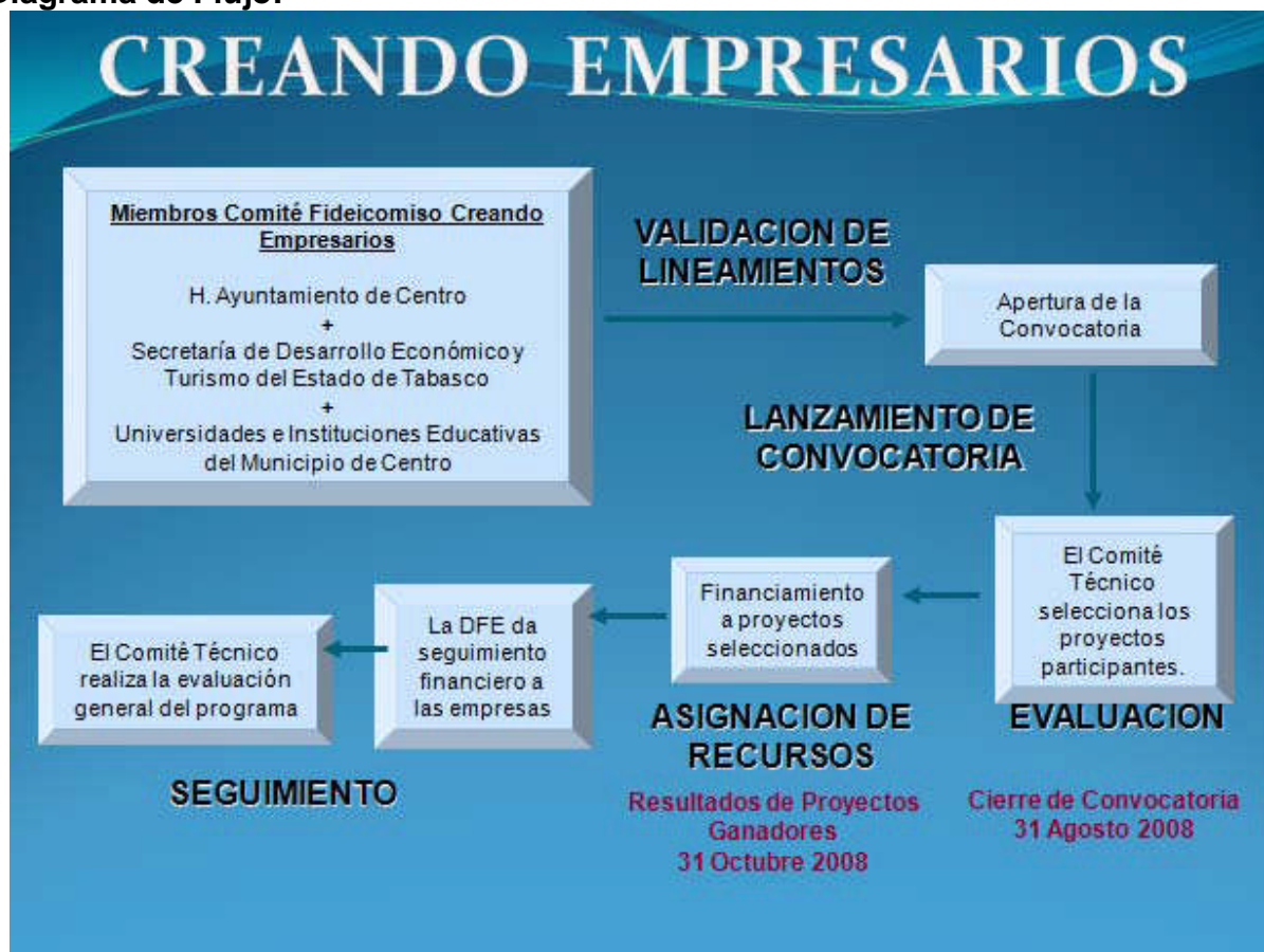
Diagrama de Flujo: