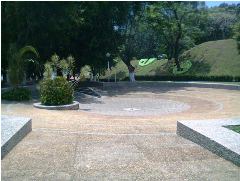
Chorro Los Poetas