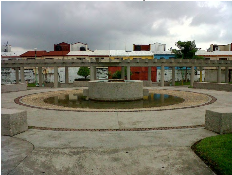
Chorro Cilindro en Pergolado